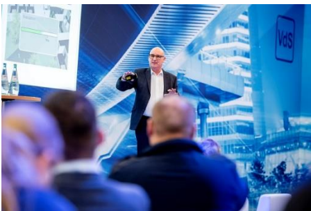
Für alle Messebesuchende kostenlos: das Zukunftsforum Brandschutz