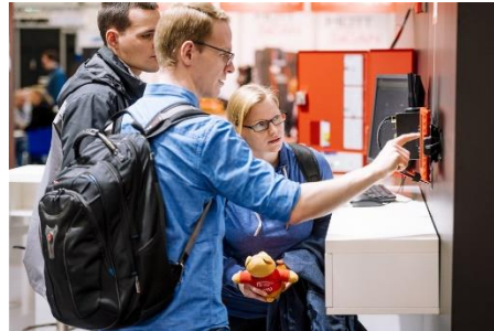
Die Besucher:innen der Messe informieren sich über Brancheninnovationen