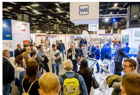
An beiden Tagen führen Messerundgänge zu interessanten Exponaten