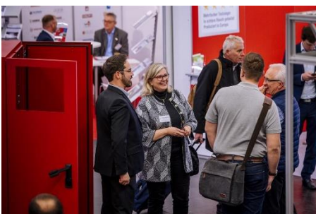
Die VdS- BrandSchutzTage bieten optimale Gelegenheiten zum Netzwerken