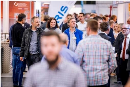
Die große internationale Fachmesse auf den VdS-BrandSchutzTagen