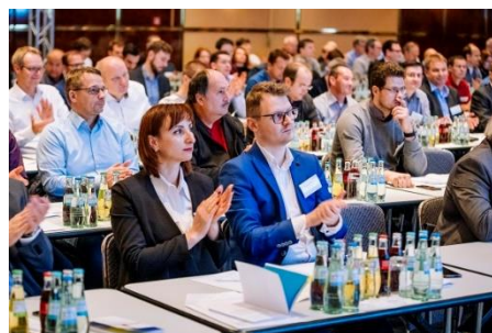
Insgesamt acht Fachtagungen finden parallel zur Fachmesse statt