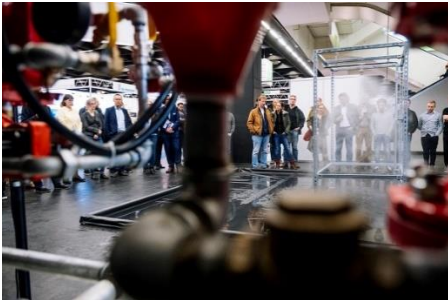
Typisch für die VdS-BrandSchutzTage sind zahlreiche Live-Demonstrationen